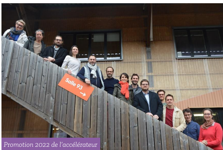
Promotion 2022 de l'accélérateur