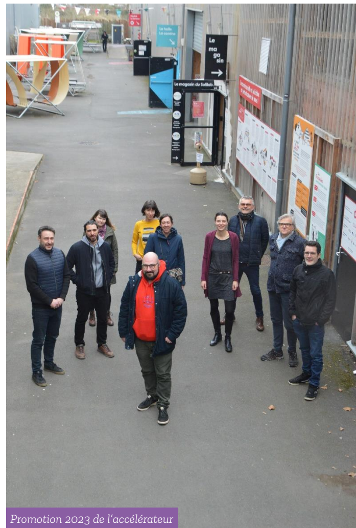
Promotion 2023 de l'accélérateur