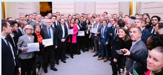
Lancement du programme ETIncelles le 21 novembre 2023 au Palais de l'Élysée.

Le programme ETIncelles au service de la croissance des PME